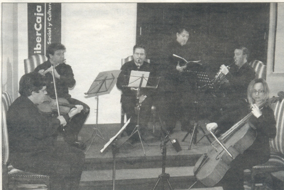
Un momento del concierto ofrecido ayer por el Grupo Cámara 6 en el Museo de Teruel

Un hecho real que llevó a pensar a Mayorga que, si hubiera escapado del jardín del científico para recorrer mundo, ese animal sería testigo "del nombramiento de once papas, de 35 presidentes de los Estados Unidos, dos guerras mundiales, la Revolución de Octubre y a la Perestroika" y, por tanto, llegaría a entender "la vasta capacidad de maldad y estupidez del Ser Humano", prosiguió el dramaturgo.